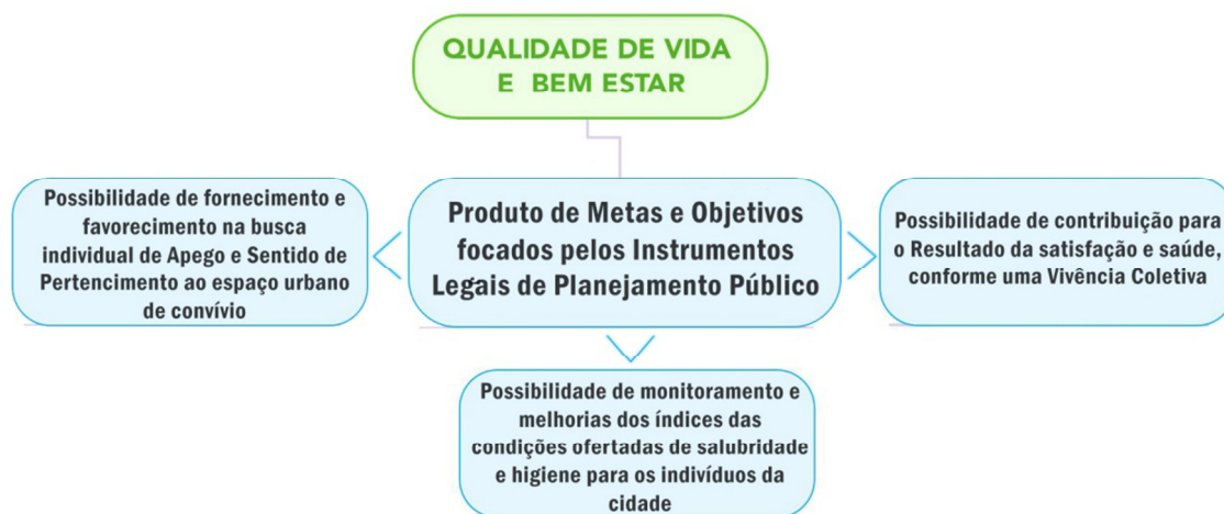
Figura 4 - Mapa mental resumo do conceito consolidado.

Abaixo, um panorama simplificando a análise que relaciona a busca pela Saúde, Qualidade de Vida e Bem Estar Urbano ao Instrumento de Ação Pública: