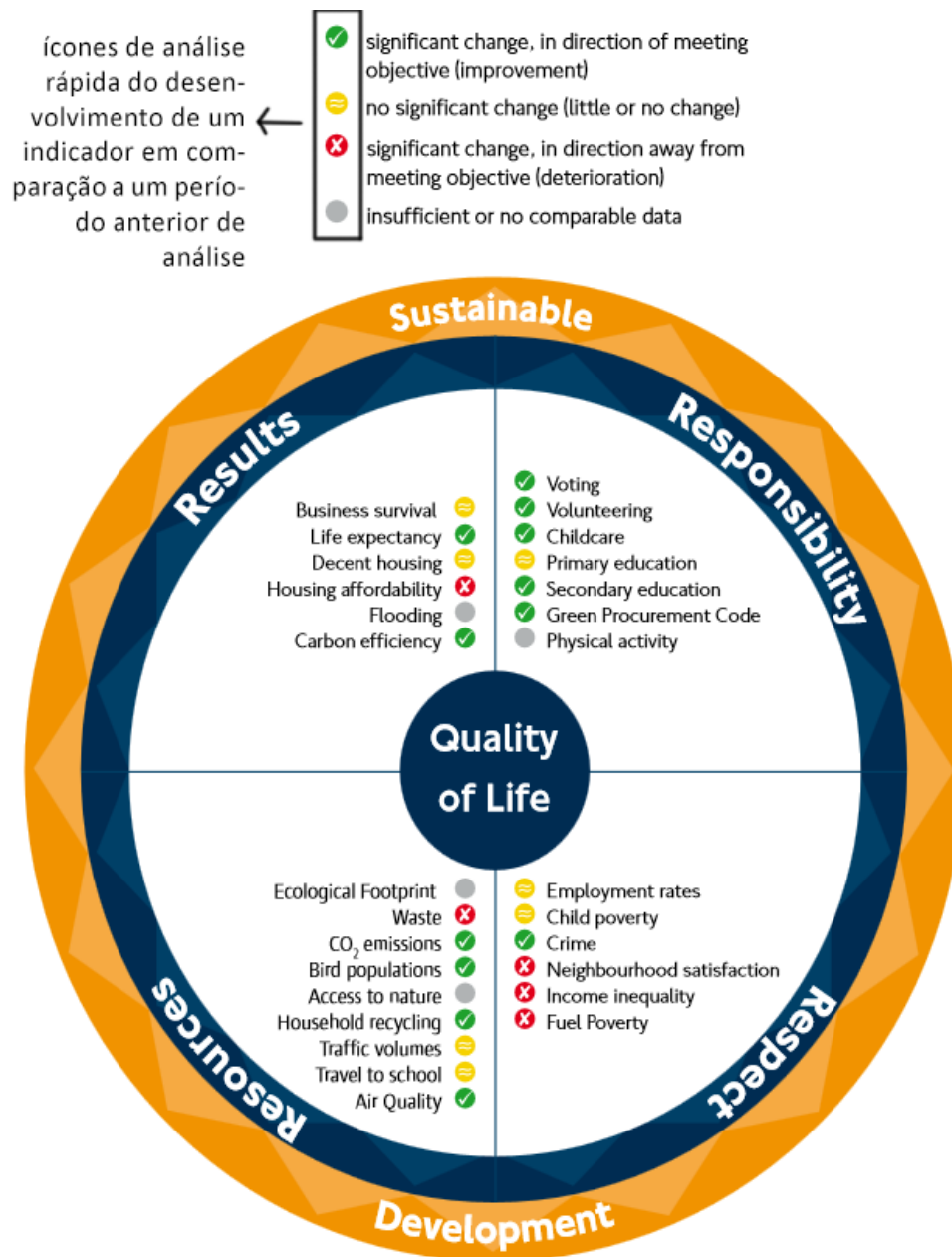
Figura 7 - Quadro resumo com todos os indicadores do programa.