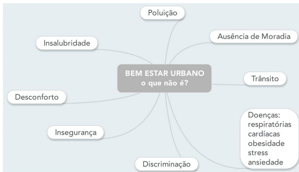
Figura 2 - Mapa mental 1 - Bem Estar Urbano, o que não é? - MAPA mental da autora desenvolvido no início do estudo do conteúdo

A seguir é apresentado dois Mapas Mentais que buscam apontar singularidades com o Tema: