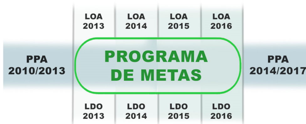
Figura 1 - Modelo cronológico que representa a relação entre os instrumentos legais de planejamento público de SÃO PAULO

prioridades de seu governo, explicitando as ações estratégicas, os indicadores e as metas quantitativas para cada um dos setores da administração pública municipal.