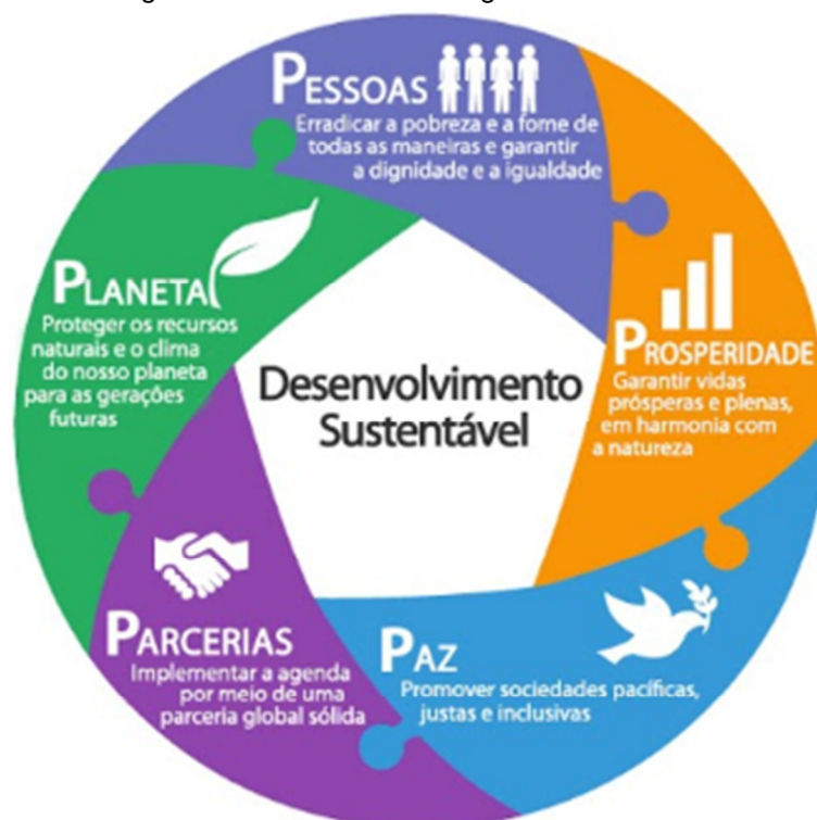
Figura 5 - Os 5 "P's" da Agenda 2030.