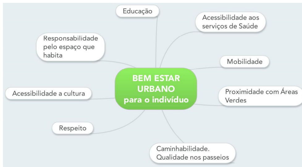
Figura 3 - Mapa mental 2 - Bem Estar Urbano do indivíduo no meio urbano - Mapa mental da autora desenvolvido no início do estudo do conteúdo